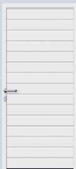
Szeroka rama skrzydła