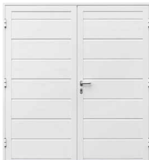
Szeroka rama skrzydła, drzwi otwierane na zewnątrz