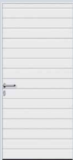
Wąska rama skrzydła