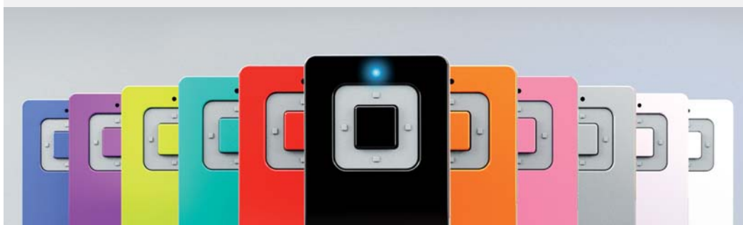
Nadajniki czterokanałowe 4GO w 11 kolorach

Współpracuje z odbiornikiem radiowym i umożliwia sterowanie napędem drogą radiową. Przy pomocy jednego pilota można otworzyć, aż cztery różne bramy (nadajnik czterokanałowy).