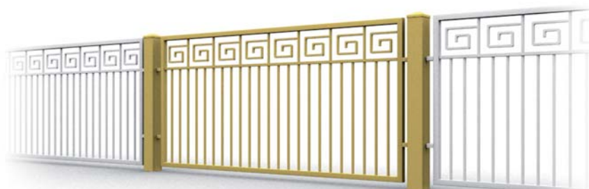
wzór: AW.10.52, widok od strony posesji